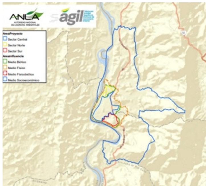
Figura. Área de influencia definitiva Parque Solar Puerta de Oro